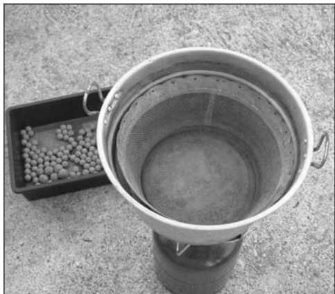
Pronti alla cottura!

cessità di essere attivi sulle rive proprio in queste ore e quindi, in qualche modo, si delineava la possibilità di vivere per qualche giorno lungo le sponde.