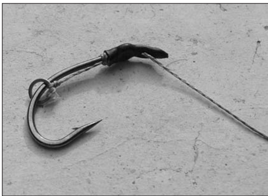
Particolare di una montatura per esche galleggianti.

Inoltre, non possiamo mancare di menzionare, per completezza di esposizione, le esche galleggianti (o come si usa dire con termine anglosassone: pop up) che rappresentano una validissima alternativa alle classiche affondanti e che altro non sono che esche di fattezze del tutto simili alle altre, ma che hanno la caratteristica di galleggiare e così danno l'opportunità al pescatore di variare nuovamente la presentazione dell'esca. Molti anni or sono alcuni carpisti riformisti si erano accorti che i classici chicchi di mais o le polente che coprivano completamente l'amo avevano dei limiti dati essenzialmente dalla scarsa selettività e dall'alta percentuale di pesci persi... occorreva pertanto cambiare qualcosa nell'approccio e nell'attrezzatura. Ecco, a grandi linee, e in maniera quanto più sbrigativa possibile, la storia della nascita di questa disciplina di pesca.