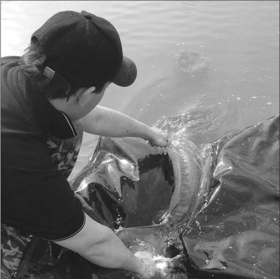
Momenti magici del carp fishing: il catch and release.

una volta nella vita, hanno sperimentato. Rimane ora solo una variabile da spiegare con maggior dettaglio per impostare le basi della disciplina di pesca: il catch and release.