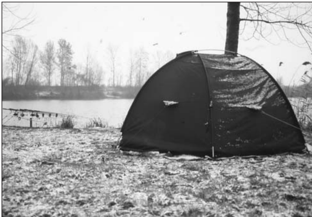
Accampamento invernale reso spettacolare dall'arrivo della neve.

Uno degli attrezzi fondamentali per il carp fishing è certamente la tenda. Essa deve essere studiata appositamente per resistere ad umidità, freddo (nel limite del possibile) ed intemperie.