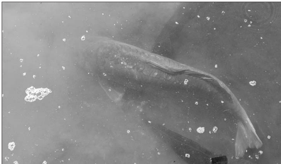
In uno scatto tutta la filosofia del carp fishing.

Il concetto base del carp fishing è quello della fusione e del rispetto del pescatore nei confronti della natura e così parlare di ecologia in riferimento alla pratica di questa disciplina di pesca è fondamentale. L'etica della moderna pesca alla carpa, infatti, si basa essenzialmente sul rispetto del pesce, sulla tutela dell'ambiente e sulla cordialità verso gli altri pescatori. I carpisti sono una sorta di Don Chisciotte sulle sponde di laghi, fiumi e canali e, fortunatamente, spesso è proprio così. I carpisti più impegnati si prendono il compito di ripulire le sponde dove campeggiano e questa abitudine deriva sia da un'attitudine personale tipica dei praticanti, sia dal fatto che passando molti giorni sulle rive si cerca in ogni modo di rendere le sponde più pulite e ordinate (a nessuno, in fondo, piace vivere nello sporco!). Il catch and release (letteralmente: cattura e rilascio) è il punto focale del pensiero del carpista moderno. Non si pesca più per mangiare, ma solo ed esclusivamente per avere un ricordo (una fotografia) di una sfida vinta nei confronti della natura e del pesce che è sì avversario, ma che viene considerato anche il migliore degli amici del pescatore.