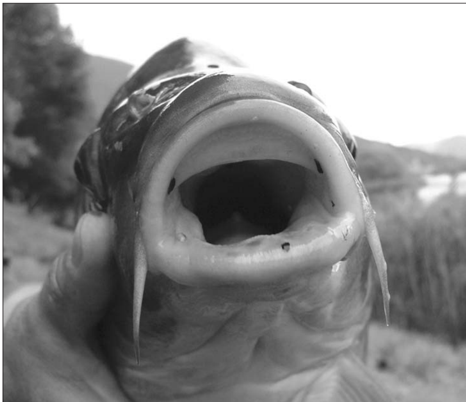
Particolare dell'apparato boccale di una carpa.

La vita all'aria aperta, specie se in prossimità di specchi d'acqua, impose così di sviluppare un'industria dedicata che sapesse far fronte alle esigenze di persone che passavano molte ore in condizioni climatico-ambientali non del tutto normali e, spesso, anche lontane dal normale campeggio estivo che tutti, almeno