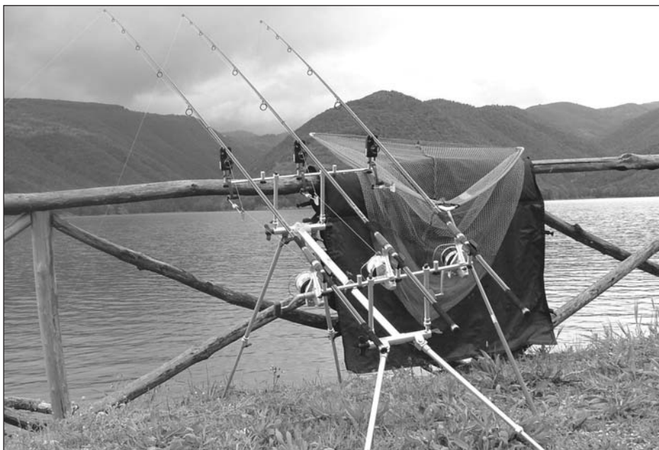
Particolari di un moderno rod pod utilizzato nel carp fishing.