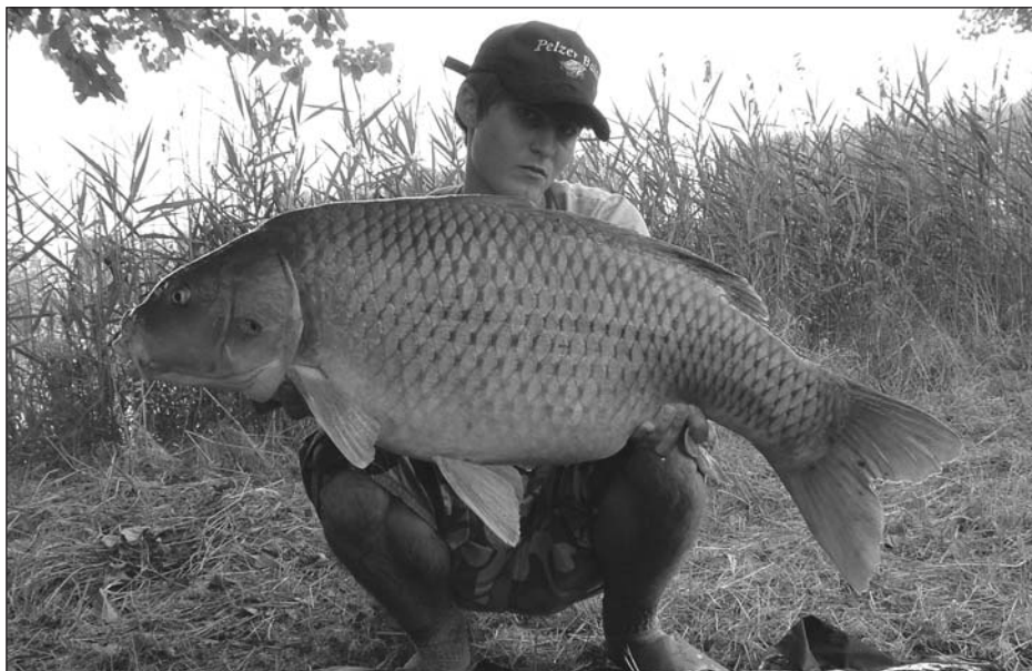
Paolo e una eccezionale cattura estiva.

Ciò che è fondamentale da capire rispetto ai concetti espressi, è che la metodologia che caratterizza la pesca alla carpa con hair rig è probabilmente la più importante rivoluzione nelle metodiche di pesca degli ultimo 20 o 30 anni. Una innovazione che ha letteralmente scardinato nozioni e certezze che hanno caratterizzato la pesca fino all'avvento del carp fishing. Una sorta di rivoluzione copernicana della pesca sportiva!