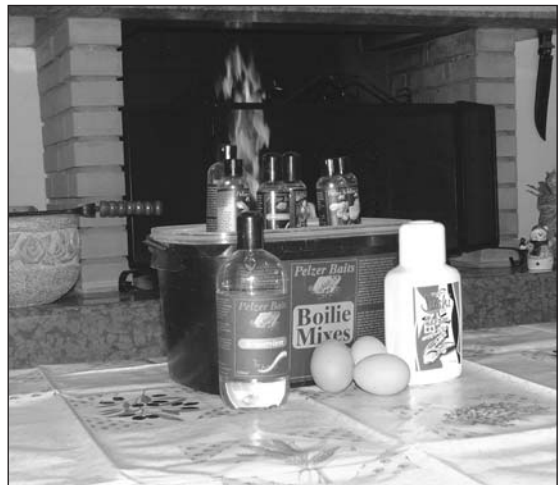
Tutto l'occorrente per la fabbricazione casalinga delle esche.

conosciute come agglomeranti) e di cuocere (il verbo inglese è: to boil) quanto ottenuto realizzando in questo modo delle palline di varie dimensioni che potevano comodamente essere inserite sui capelli lasciando in questo caso l'amo libero di muoversi e di agire in modo consono. Erano nate le boilies, le esche che da qui in poi erano diventate patrimonio tecnico di tutti i pescatori di carpe. Entrare nel merito della realizzazione di queste esche richiederebbe un'enciclopedia.