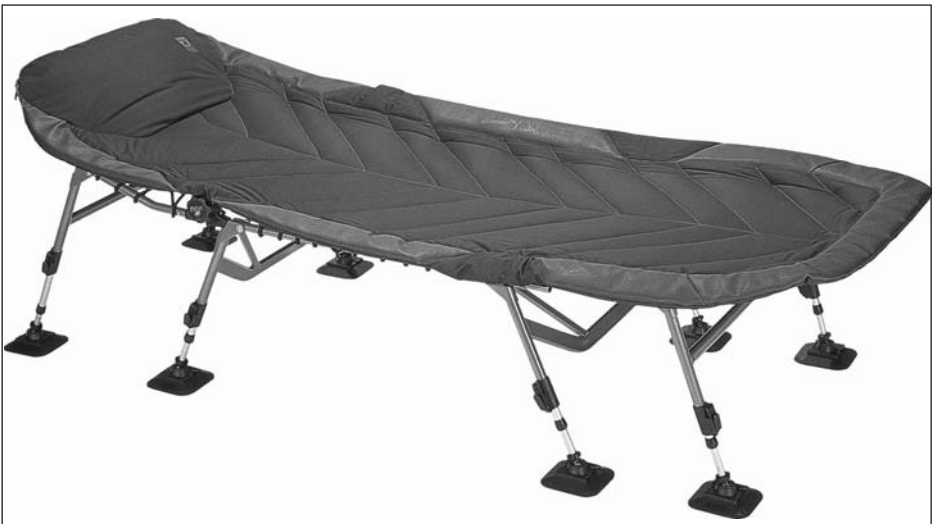
Lettino (bedchair) per dormire comodamente durante l'uscita a pesca.

Ancora meglio se i lettini sono di peso contenuto, perché gli eventuali spostamenti dall'auto al luogo di pesca siano il meno faticosi possibile.