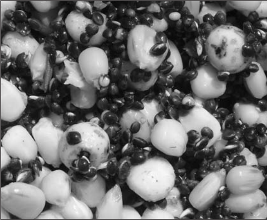
Alcune esche naturali, una valida alternativa alle moderne boilies.

Per ora ci basti pensare alle boilies come ad un agglomerato di farine di vario genere, uova, additivi liquidi come sweetner (dolcificanti), aromi e in alcuni casi complessi di aminoacidi di varia natura cotte (in acqua o a vapore) e fatte essiccare per ottenere delle palline dure e resistenti in acqua anche per lunghi periodi. Abbiamo pertanto definito come sono nati terminali ed esche da carp fishing, ci rimane ora da capire il perché di questa strana abitudine ad accamparsi sulle sponde dei fiumi o dei laghi per molti giorni con tende, lettini e quant'altro per pescare le carpe. Le carpe sono animali che grufolano sul letto del corso d'acqua e la loro attività alimentare è pressoché presente a tutte le ore del giorno e della notte.