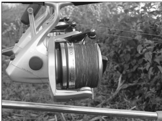
Mulinello da long range tipico della nostra disciplina.

Il mulinello è uno degli attrezzi distintivi del carp fishing. I primi mulinelli dichiaratamente dedicati alla disciplina erano provvisti di un meccanismo automatico di sbocco della bobina (denominato baitrunner) che ha per lunghissimi anni distinto in maniera inequivocabile gli attrezzi per la pesca alla carpa.