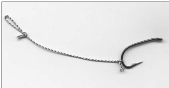
Un prototipo dei primi hair rig.

Ripercorrere questi eventi oggi può sembrare quasi scontato e per nulla innovativo, ma queste idee geniali in quegli anni furono una sorta di rivoluzione e il fatto che a tutt'oggi quei concetti rimangono di un'attualità assoluta dovrebbe far capire anche ai più scettici che probabilmente questa tecnica ha rivoluzionato la pesca moderna. Da qui in poi si potrebbe aprire un universo immenso di considerazioni circa le varie montature che si sono succedute negli anni, le varie presentazioni delle esche e le innumerevoli varianti sul terminale.