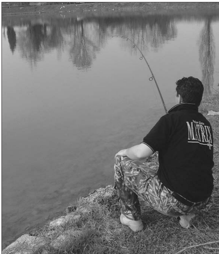
Fasi finali del recupero di una bella preda.

Alla luce di ciò sono identificabili canne con test curve pari a 2lb, 2.5lb, 2.75lb, 3lb, 3.25lb e 3.5lb e ognuna di esse ha un suo utilizzo specifico e si adatta a determinate condizioni di pesca.