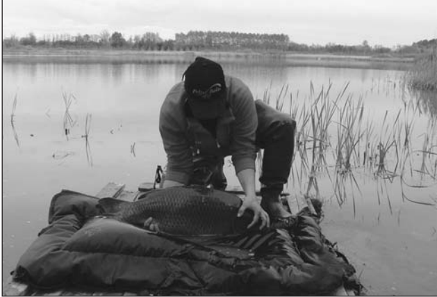
Una carpa adagiata su un materassino poco prima della foto di rito.

modo che la sicurezza del pesce resti al primo posto. Il vero carpista dovrebbe acquistare prima un ottimo materassino di slamatura e poi, eventualmente, un'attrezzatura costosa e al top... anche se, purtroppo, spesso queste variabili temporali vengono invertite.