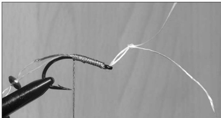
Fasi di realizzazione di un moderno terminale per la pesca alla carpa.

Ciò che è fondamentale da capire rispetto ai concetti espressi, è che la metodologia che caratterizza la pesca alla carpa con hair rig è probabilmente la più importante rivoluzione nelle metodiche di pesca degli ultimo 20 o 30 anni. Una innovazione che ha letteralmente scardinato nozioni e certezze che hanno caratterizzato la pesca fino all'avvento del carp fishing. Una sorta di rivoluzione copernicana della pesca sportiva!