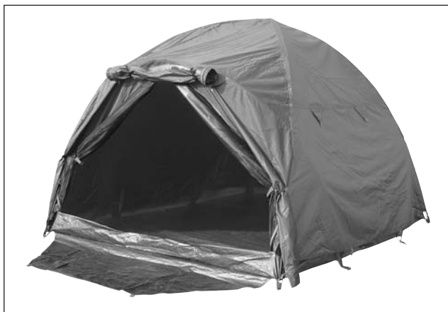
Moderna tenda da carp fishing.

Ci rendiamo assolutamente conto del fatto che acquistare una intera attrezzatura da carp fishing è cosa assai dispendiosa dal punto di vista economico, ma stiamo parlando di uno di quegli attrezzi su cui il risparmio si traduce in scarsa sicurezza e, in alcuni casi, di pericolo. Alla luce di ciò, pertanto, consigliamo vivamente, piuttosto, di risparmiare su canne e mulinelli, ma mai su tende o accessori ad esse connessi. Il loro colore deve assolutamente essere verde o mimetico; non per stupide fissazioni, ma perché il nostro impatto sull'ambiente deve essere sempre il meno traumatico possibile. Dobbiamo arrivare al punto di non essere di disturbo alla natura! Il nostro passaggio dovrebbe essere “in punta di piedi”, una sorta di presenza che oggi c'è, ma che domani non deve lasciare alcuna traccia! Acquistiamo tende con teli anticondensa, di buon spessore e con cuciture termosaldate di ottima fattura.