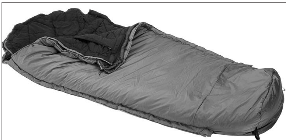
Sacco a pelo cinque stagioni adatto anche alle temperature più rigide.

cienza per permetterci movimenti ed eventuali “fughe” verso le nostre canne. Esistono migliaia di modelli e marche diverse che commercializzano questo prodotto. A nostro avviso, senza un buon sacco a pelo è assolutamente sconsigliabile affrontare sessioni con temperature rigide. È altresì importante capire che il sacco a pelo non è un accessorio valido solo nelle sessioni invernali, anche d'estate spesso risulta utilissimo perché l'umidità in riva a canali, fiumi, laghi e cave è sempre molto pronunciata sul calar del giorno e un buon sacco a pelo ci ripara e ci tiene asciutti anche in presenza di forte umidità esterna. È importante comprendere il concetto che mantenere una temperatura corporea